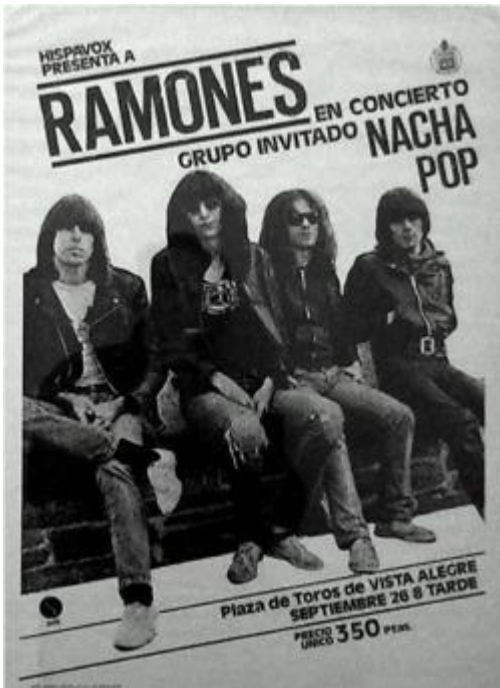
Ilustración 6: Cartel del concierto de los Los Ramones, con Nacha Pop de teloneros.