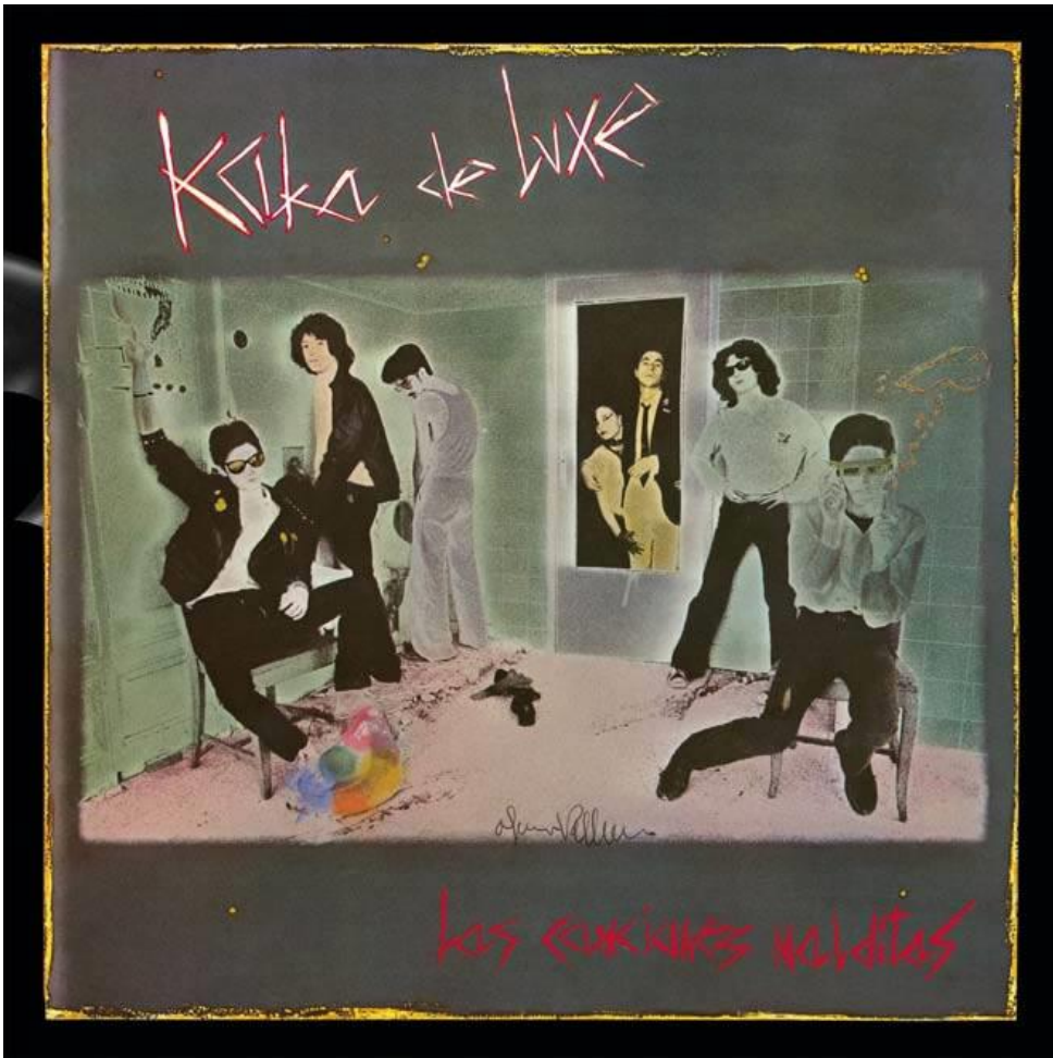
Ilustración 5: Portada del único disco de Kaka de Luxe: 'las canciones malditas'.