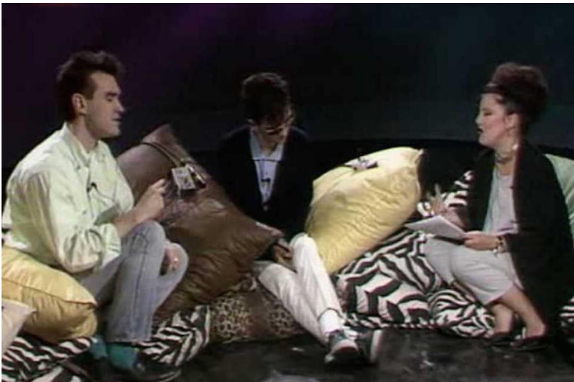
Ilustración 4: The Smiths y Paloma Chamorro en el programa 'La Edad de Oro'.