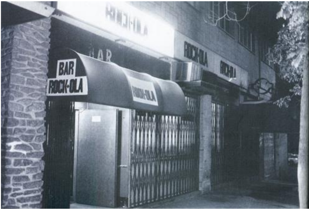
Ilustración 3: Mítica sala/bar Rock-Ola