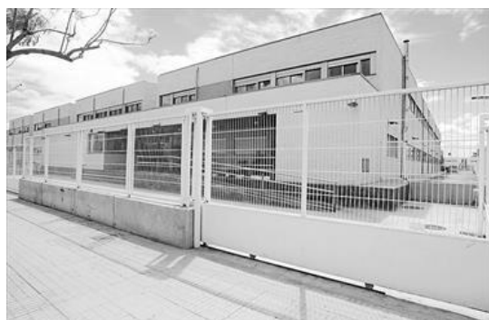
Figura 4: Entrada del IES VILA-ROJA

Está bien ubicado, por tanto, no hay ningún problema para acceder al centro, a excepto por el alumnado que vive en la playa, pero este inconveniente se resuelve cuando en el curso 2011-2012 tienen asignado un autobús. También hay estudiantes de otras localidades porque ofrece los ciclos formativos de Imagen y Sonido.