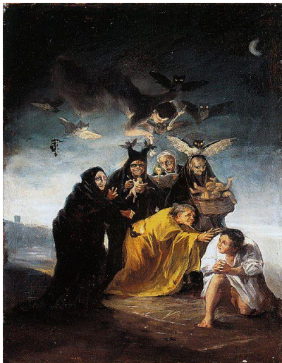
Las brujas, Goya (1798)

http://www.laespadaenlatinta.com/2014/09/resena-brujas-sapos-aquelarres-pedraza.html