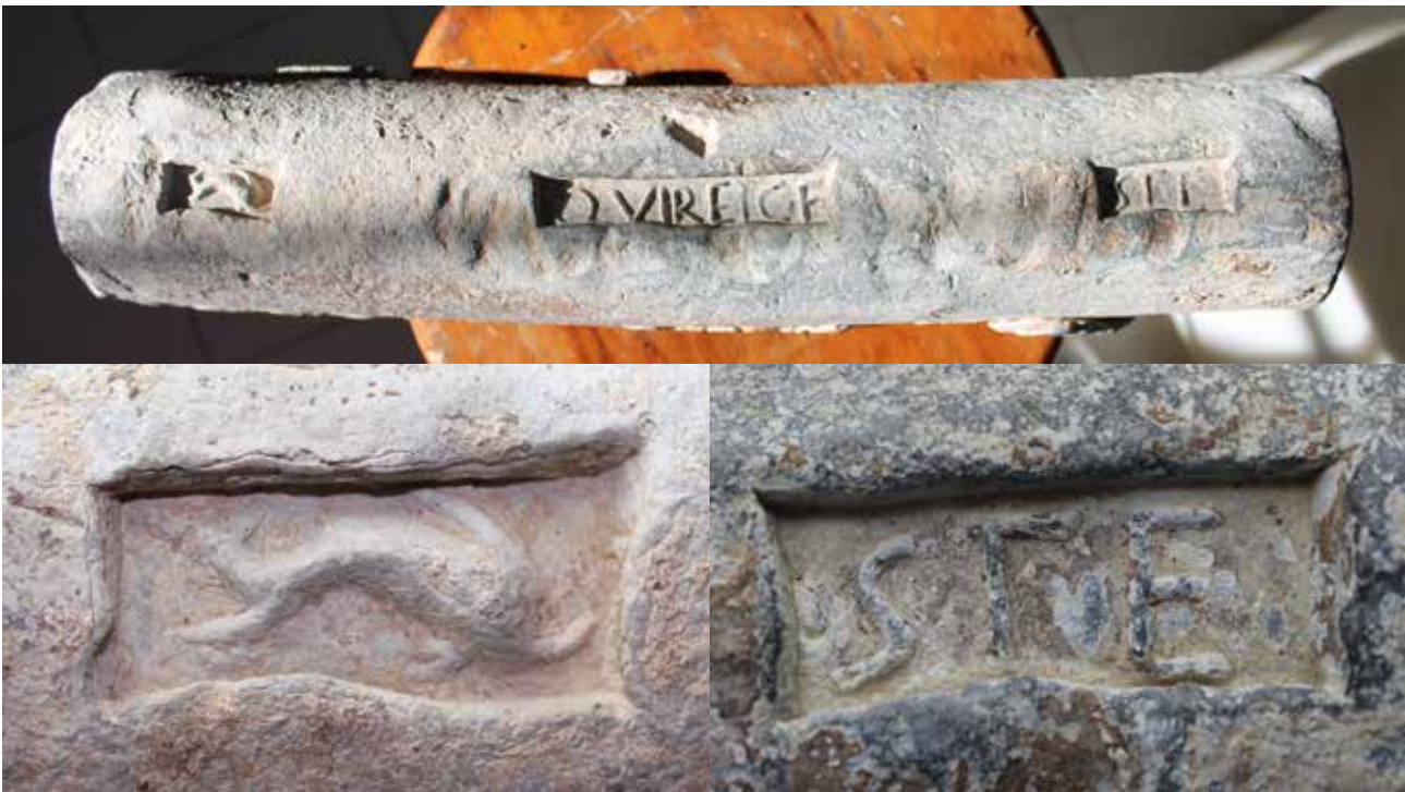
Figure 6. Lingot 2 de Torre de la Sal (n° 1637: Museu de Belles Arts de Castellón de La Plana), vu de dessus et détails des deux cartouches extrêmes.