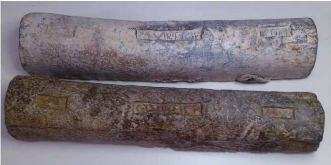
Figure 4. Les lingots de Torre de la Sal vus de dessus (Museu de Belles Arts de Castellón de La Plana).

cun pour un total variable de 60 à 80 rapports isotopiques. Le résultat est constitué par la moyenne d'au moins trois opérations indépendantes et la précision interne finale a été en moyenne < 30 ppm.