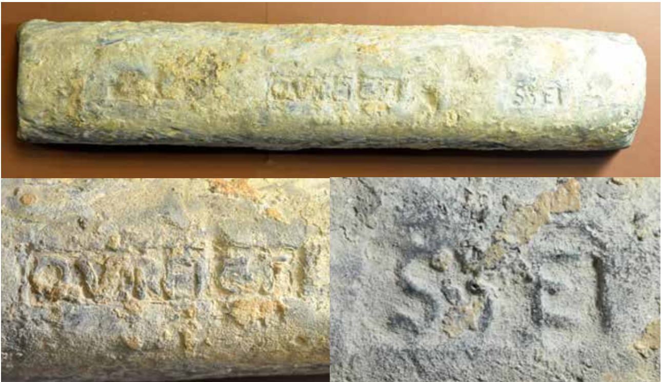
Figure 3. Le lingot de Ses Figueretes (Ibiza) vu de dessus et détails des deux derniers cartouches.

Le lingot est en assez bon état, mais il est fortement érodé; les trois cartouches sont distincts, mais peu profonds; du coup, le symbole et les lettres sont moins bien conservés. Dans le cartouche gauche, seul le contour du dauphin est identifiable; dans les deux autres, le tracé des lettres, qui d'ordinaire présente une fine section transversale en arête, est ici écrasé, et bordé d'une couche carbonatée qui l'épaissit et l'empâte. Les inscriptions sont néanmoins lisibles, à l'exception du T de STE et de quelques points de séparation, et l'on voit bien, dans le cartouche central, la branche inférieure du C plus courte que l'autre: