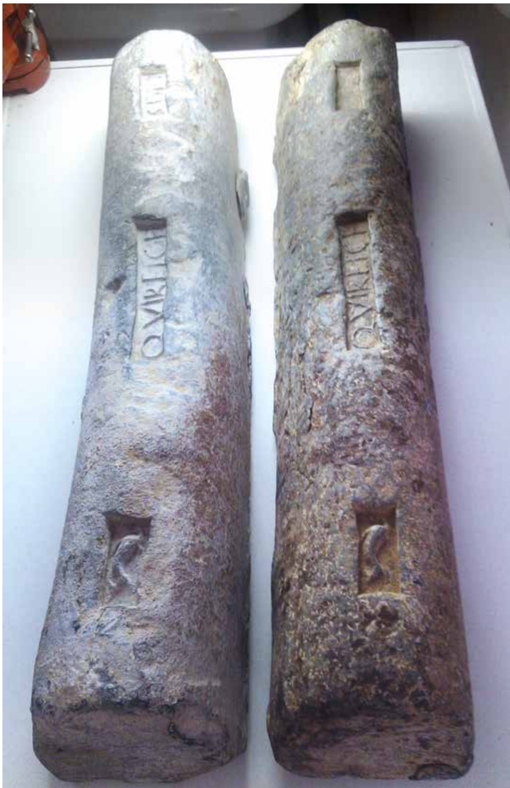
Les lingots de Torre de la Sal vus de dessus (à g.) et de côté en lumière oblique (à dr.) (Museu de Belles Arts de Castellón de La Plana) (cliché A. Fernández Izquierdo CASCV).