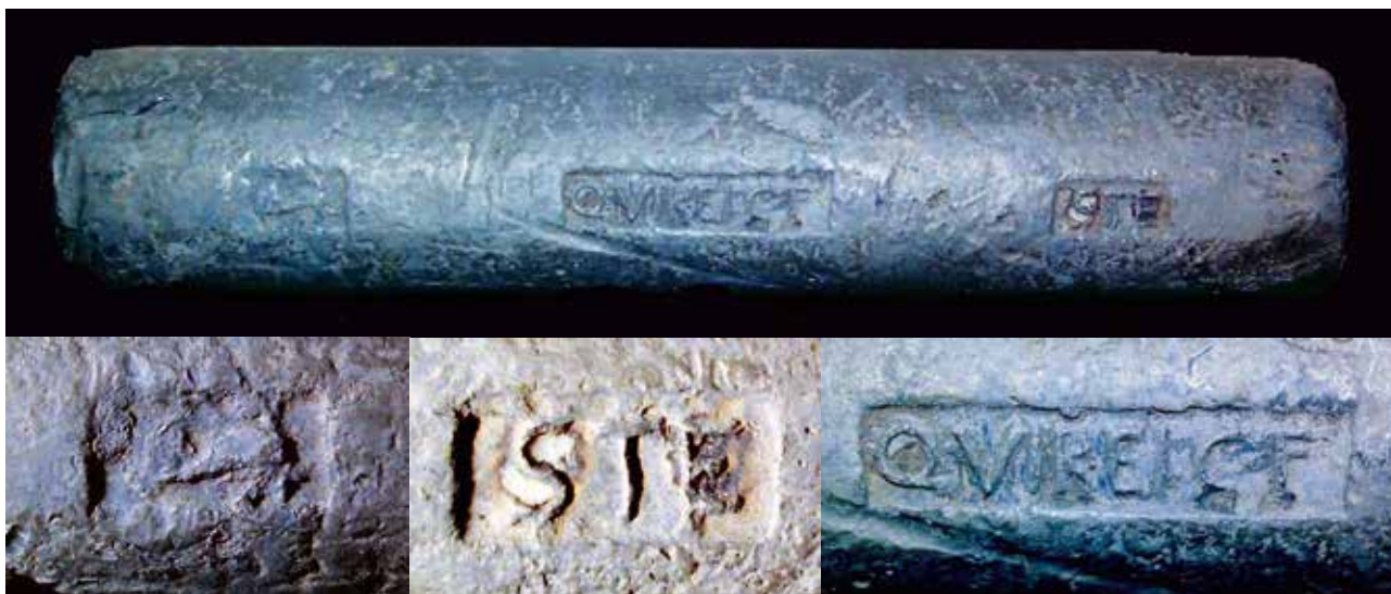
Figure 2. Le lingot de Santa Severa (Italie) vu de dessus et détails des trois cartouches.

Ce dernier l'aurait découvert lui-même dans sa jeunesse au cours d'une plongée en mer, face au castello de Santa Severa. Il l'aurait lui-même nettoyé mécaniquement (le cartouche gauche semble en avoir souffert) et débarrassé de ses concrétions 3 . A quelques détails près, le lingot est en très bon état.