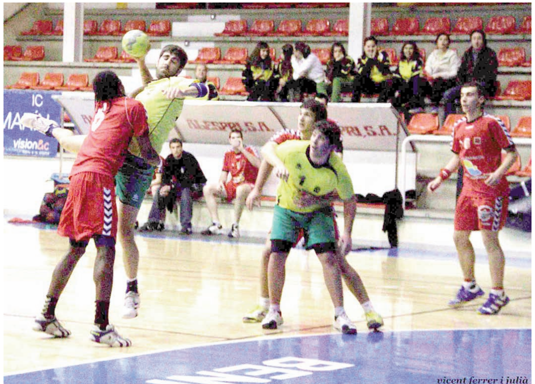
vicent ferrer i julià

La Primera Divisió Autònoma Femenina la componen: Baix Maestrat Benicarló, Énguera, Maristas Algemesí, Oliva, Puçol, Riola i Vila-real.