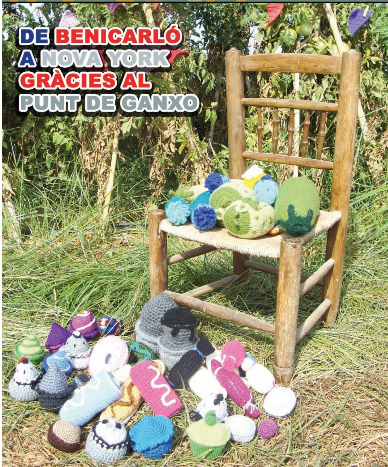
“Arrea-li Bona” guardonat en els actes del Dia de la Pilota 2012

DE BENICARLÓ A NOVA YORK GRÀCIES AL PUNT DE GANXO