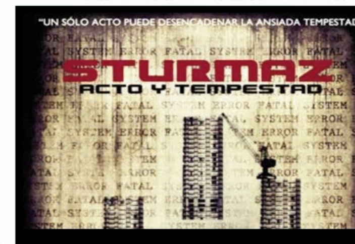
Capçalera de la sexta notícies que s'ha fet ressò del curt