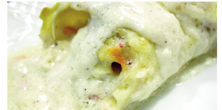
A les imatges, algunes de les propostes de Cafeteria Viena.