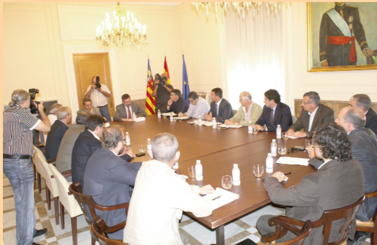
Tots són alcaldes?

Ara, aquesta reunió, segons tenim entès, era amb els "alcaldes" costaners. I diem alcaldes. Doncs, a nosaltres hi ha una cosa que no ens quadra massa. Us ho expliquem. Si a la reunió només anaven els alcaldes, a la foto que ens han