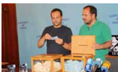
Momento del sorteo