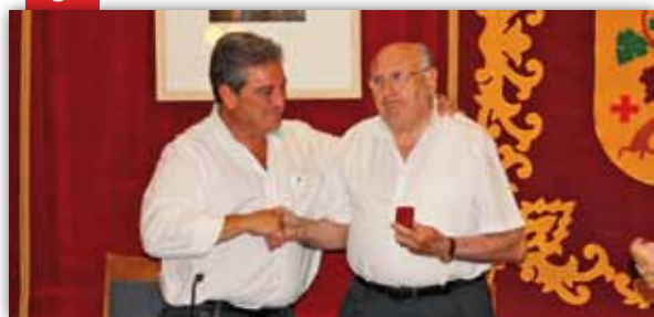
L'arxiu municipal s'enriqueix