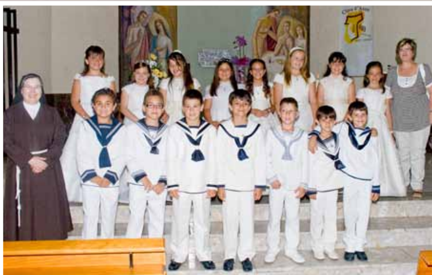
El domingo 17 de junio los alumnos de 3º de primaria del colegio Divina Providencia, se reunieron para celebrar una misa en recuerdo de su 1ª comunión