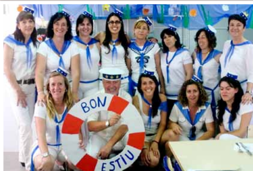
Ens anem de vacances des de Jaume I a Menorca