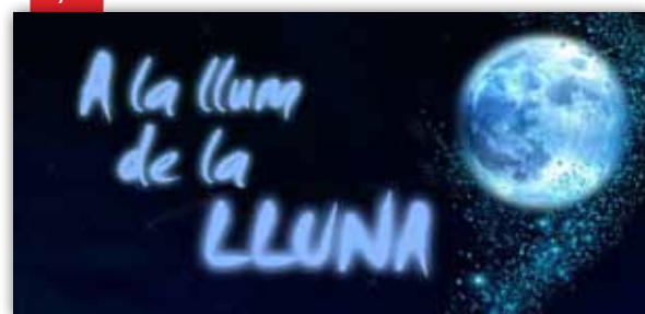
Actes 'A la llum de la lluna'