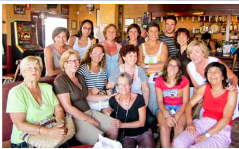
En la Taberna, viendo el programa de Pasapalabra las FANS DE CARMEN PASAPALABRA.