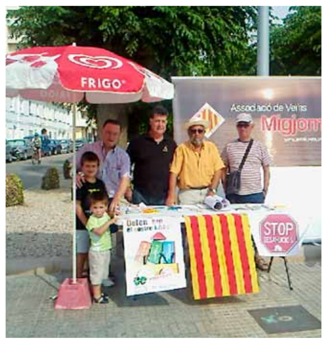
L'Associació de Veïns Migjorn va recollir Durant dos dijous signatures per a la campanya Iniciativa de Legislatura Popular de dació per pagament iniciada per la Plataforma d'Afectats per la Hipoteca