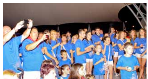
Gresca carnavalesca d'estiu

16 de juliol-verge del Carme Mare de Deu del Carme, Doneu-me un bon marit Sia pobre o sia ric Mentre vingue de seguit