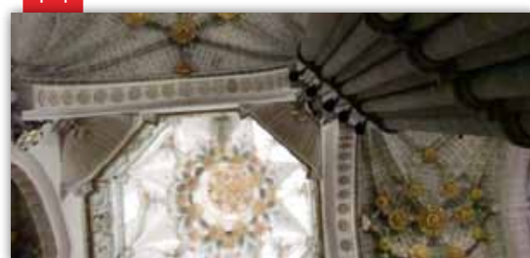
Amics de Vinaròs, a un congrés