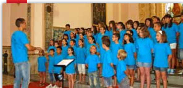
Aniversari Coral Assumpció