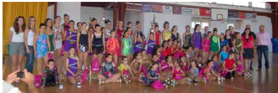
Club Patinatge Artístic Vinaròs

El pasado día 15 y 16 de Junio, nuestra entidad, celebró el I Trofeu Ciutat de Vinaròs con participación de 110 patinadores.