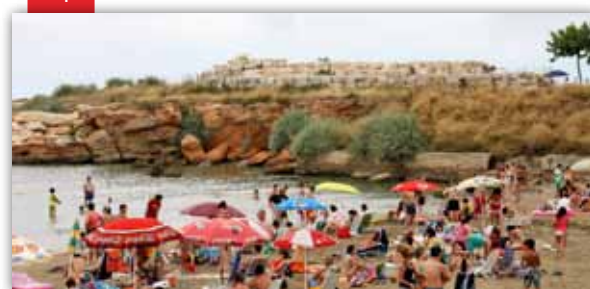
Bandera Qualitur per a les platges