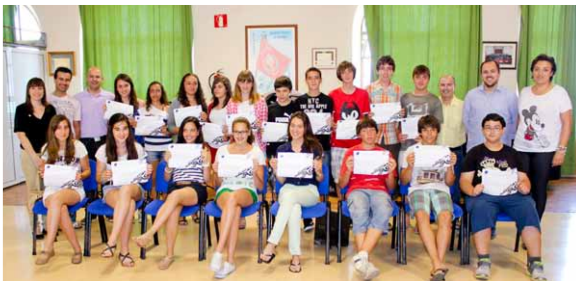
Lliurament dels diplomes als alumnes que han finalitzat els estudis de llenguatge musical a l'Escola de Música de la Societat Musical la Alianza.