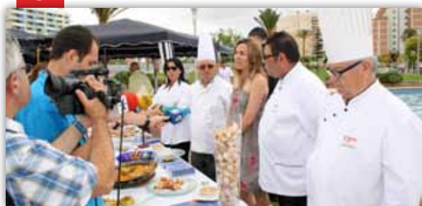
Jornades Gastronòmiques del Llagostí