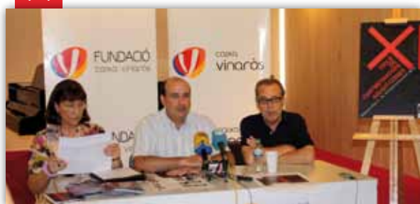
XI Cicle de Curtmetratges