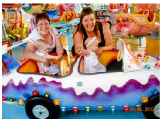
Disfrutando en la feria