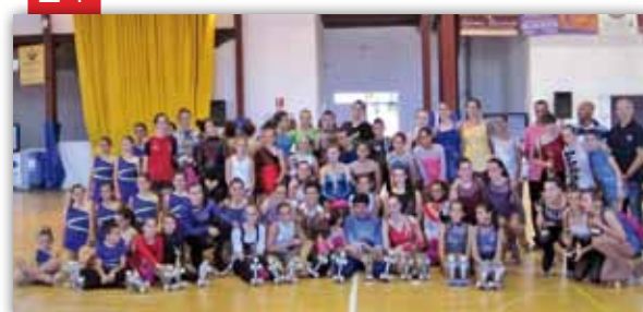
Patinatge: Trofeu ciutat de Vinaròs