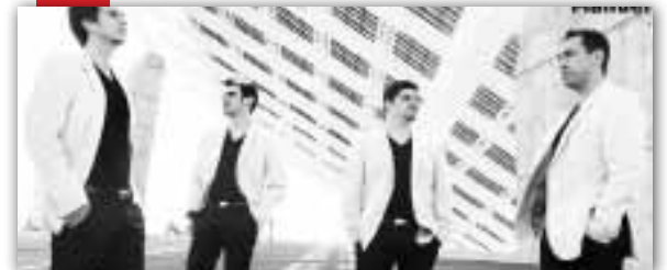
Concert BCN Brass Ensemble