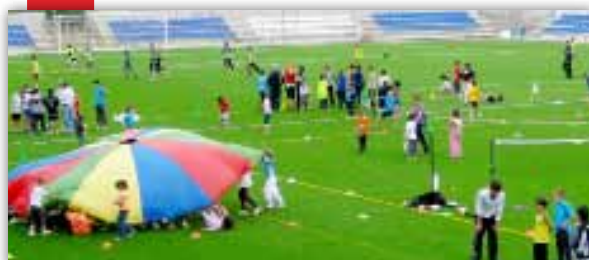
Festa final de les Escoles Esportives 2010/2011