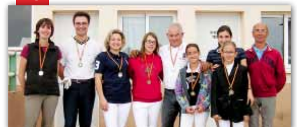
Concurso hípico en Ecuvin