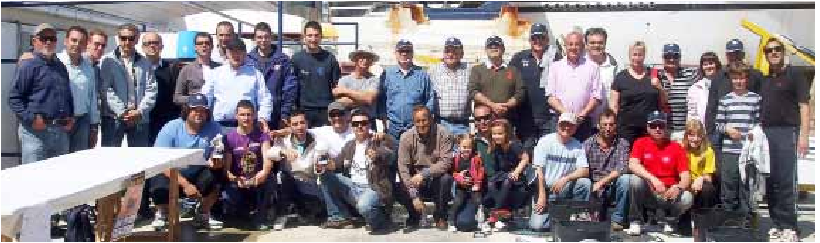
Foto de grupo del 2º Concurso de pesca en la modalidad de curricán costero del Club Náutico Vinaròs