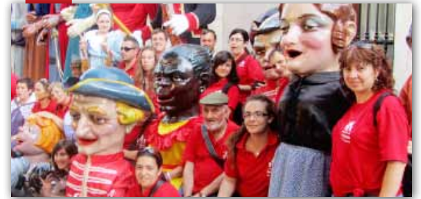
Els Nanos i Gegants, a la Safor