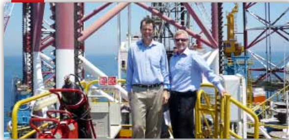
El Embajador de Canadá en España visita el Castor