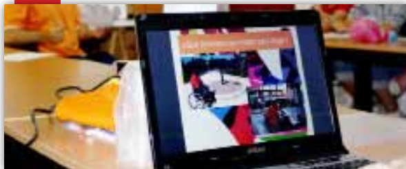
Asociacionismo y voluntariado Una iniciativa joven