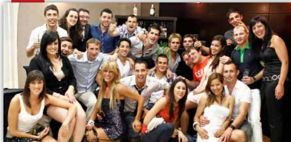
El Vinaròs C.F. celebra el seu ascens