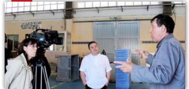
Se impulsa el destino gastronómico de Vinaròs