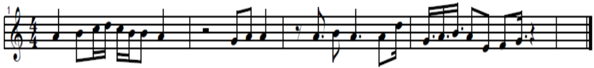
Il·lustració 2. Partitura d'elements musicals.