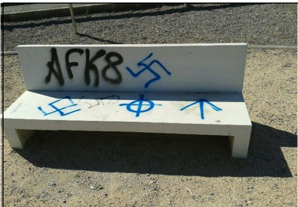
Foto 7: Varios símbolos xenófobos pintados en un banco. Simbología: