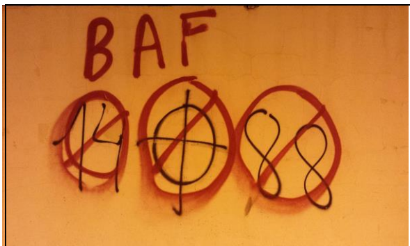
Foto 3: Pintada con simbología xenófoba. Simbología:

Se aprecia también el símbolo del yugo, el haz de flechas y el nudo gordiano, que está relacionado con el símbolo de la falange española, de ideología fascista.