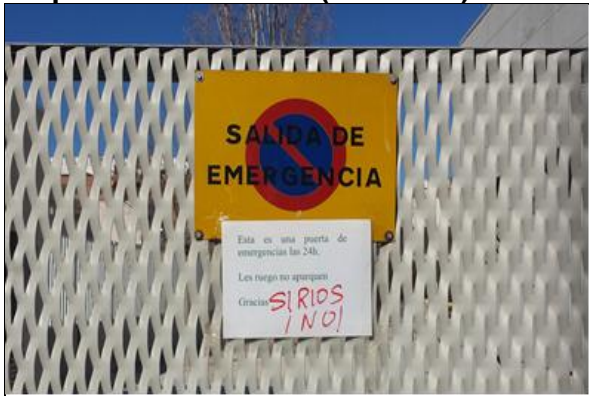
Foto 1: Escrito con características xenófobas, con mensaje "SIRIOS ¡NO!", aparecida en centro escolar en Vila-real (que es ciudad de acogida de refugiados sirios). En este caso no se aprecia simbología xenófoba sino que se trata de un mensaje xenófobo directo.