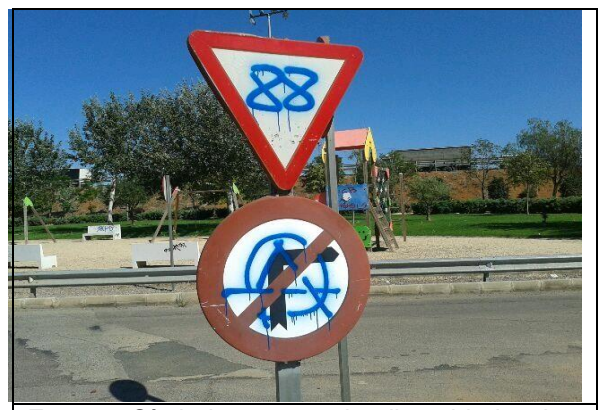
Foto 8: Símbolos contra la diversidad sobre señal vertical de tráfico. Simbología:

Runa Odal. Emblema de la 7ª División de Montaña SS Prinz Eugen del ejército nazi.