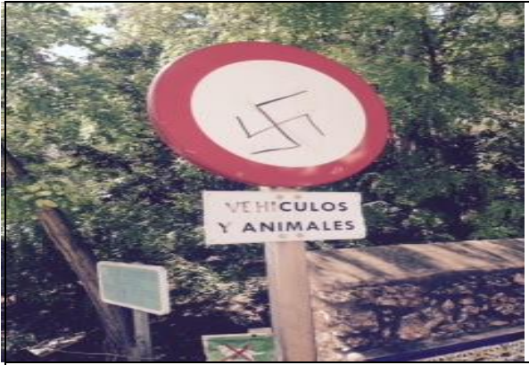
Foto 5: Símbolo contra la diversidad sobre señal vertical de tráfico. Simbología: