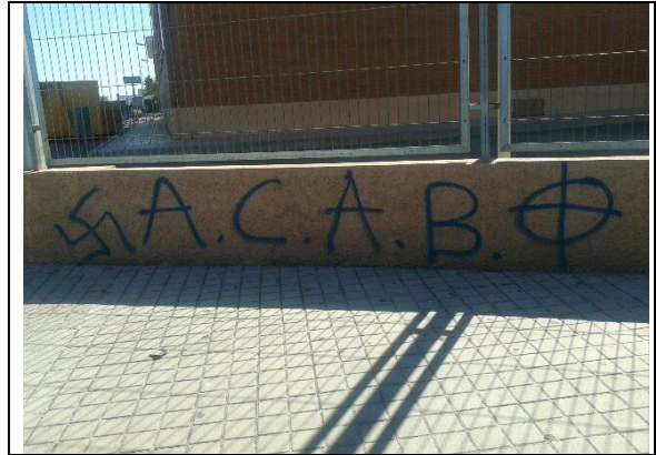
Foto 6: Pintada con mezcla de simbología xenófoba/racista y anti-sistema. Simbología:

La esvástica es el símbolo por excelencia nazi, pese a que su origen es hindú, representa los 4 elementos (fuego, tierra, agua y aire) y significa prosperidad, buena fortuna, salud y gloria. Los nazis la adoptaron como emblema en 1920. Hitler la ve como el símbolo de la "lucha por la victoria del hombre ario".