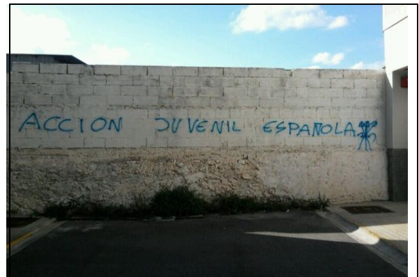
Foto 2: Pintada con lema Acción juvenil española: agrupación nacional-catolicista de corte fascista.