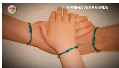
Imagen 2. Expresión del pacifismo en el capítulo 2

Por su parte, el análisis mostró una identificación clara de los actores y factores que son sindicados como causantes de la situación de violencia que experimentan los afectados. Estos son el Partido Popular, la banca, la ley de vivienda, y de manera secundaria, la policía por su papel represor en las manifestaciones. En el capítulo 3, se incluyen imágenes de efectivos policiales deteniendo a la fuerza a algunos activistas mientras un portavoz informa sobre la situación de algunos heridos y detenidos.