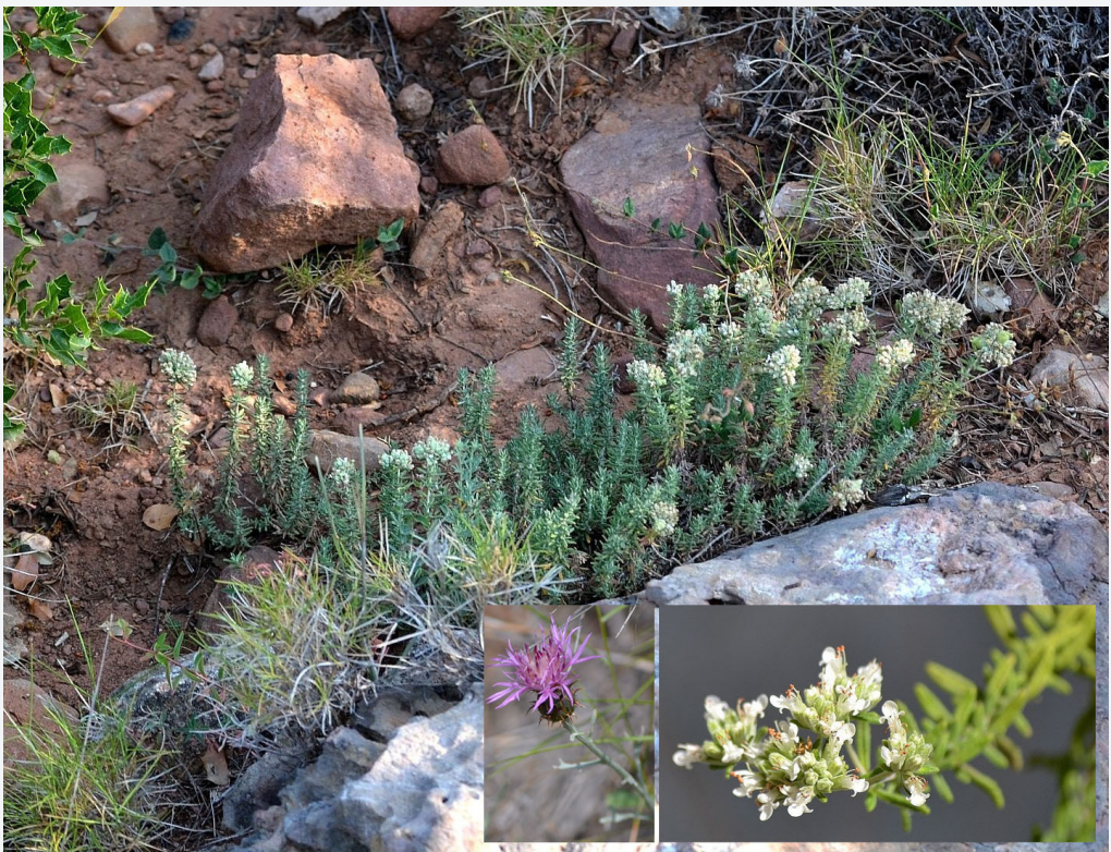
FIGURA 2. Espècies característiques de l'associació Teucrium muletii-Brachypodietum retusi : Teucrium muletii i Centaurea fabregatii .

Buntsandstein. Fins i tot als ecòtops on les argilites presenten un pH lleugerament àcid, el llistonar sol contactar amb el Helianthemo mollis-Ulicetum parviflori subassoc. lavanduletosum stoechadis , és a dir, amb el romerar enriquit amb alguns dels elements florístics propis de les brolles d'estepes litorals més freqüents a aquesta zona ( Lavandula stoechas , Cistus salviifolius , C. monspeliensis ). El "poliol o timonet mascle" de Mulet ( T. muletii ) té preferència dins d'aquestes formacions de llistonar per fondalades o forats i clivells del pedruscall, amb un comportament i ecologia no poques voltes subsaxícola o subrupícola. En altres ocasions, les brolles serials presents a la zona tenen un clar significat transicional entre la Rosmarinetea officinalis i la Cisto-Lavanduletea stoechadis , com ara per exemple es pot apreciar