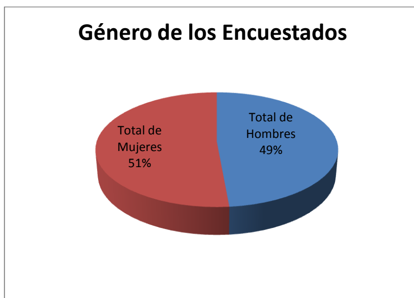
GRAFICO I : EDAD Y GÉNERO