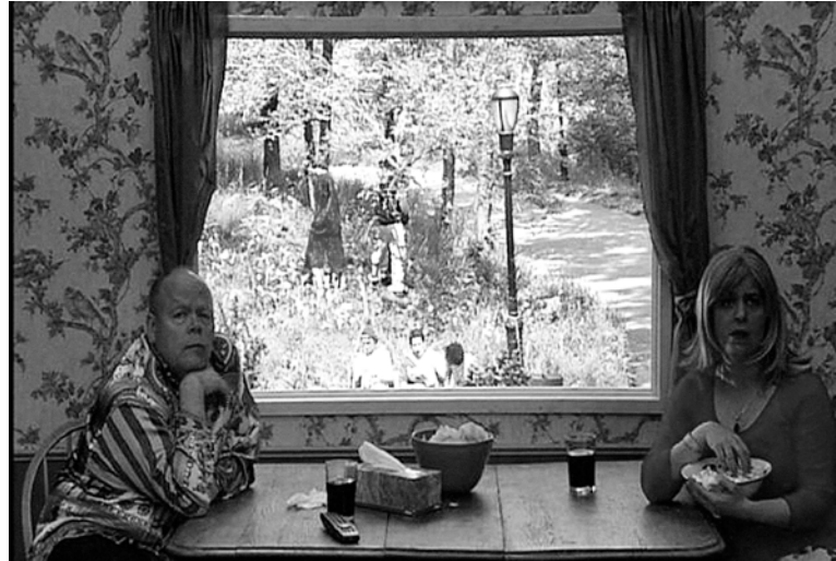
Fig. 6. Shoja Azari, A Room with a View , 2004

La exposición Contraviolencias. Prácticas artísticas contra la agresión a la mujer 7 , comisariada por Piedad Solans e inaugurada el día 28 de noviembre de 2010 en la sala Koldo Mitxelena de Donosti, hace hincapié no sólo en la perpetuación del patriarcado como forma de violencia contra la mujer, sino que además se propone inscribirla en «una crítica a la cultura y a las estructuras de poder con sus tecnologías y mecanismos de producción, control y distribución de la violencia» (Solans, 2010: s/n). A través de las propuestas de quince artistas que trabajan en una diversidad de formatos 8 la denuncia contra la violencia se sitúa en la necesidad crítica de transformar las mismas estructuras de poder en donde la violencia se inscribe. «La cuestión artística pasa de la concepción del cuerpo privado a la del cuerpo estatal, configurando las tecnologías imaginarias y los mapas geográficos, simbólicos, políticos y sociales de la violencia» (Solans, 2010: s/n).