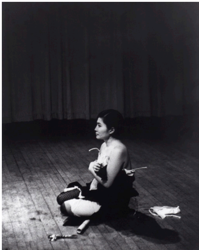
Fig. 1. Yoko Ono, Cut Piece , 1965

Yoko Ono, en la performance Cut Piece (1965) (fig. 1) se subió a un escenario vestida con sus mejores ropas y colocó junto a ella unas tijeras. Los espectadores estaban invitados a ir cortándole uno a uno trozos de sus ropas. Ella permanece inmutable, ajena a la agresión. Este trabajo de difícil interpretación 1 ha sido considerado como una de las obras claves en la representación de «la subordinación de género, violación del espacio personal de una mujer y de la violencia contra las mujeres» (Tanner, 1994: 61).