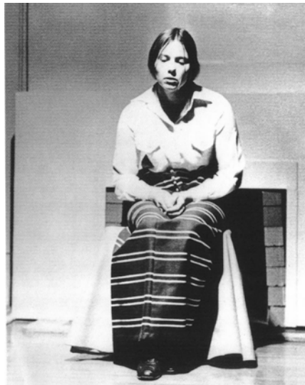
Fig. 3. Faith Wilding, Waiting , 1971

Releemos este momento histórico de la aparición del pensamiento feminista desarrollado a partir de los años 60 fundamentalmente ligado a la defensa de la igualdad, entre cuyas referencias ineludibles se encuentra la emblemática obra de Simone de Beauvoir El segundo sexo (1949). Su conocida afirmación de que «no se nace mujer; se llega a serlo» (Beauvoir, 1949, tomo II: 13), comprende una de las ideas más revolucionarias para la teoría feminista: el papel que la mujer asume en la sociedad le viene impuesto, no por su circunstancia biológica, sino por el sometimiento al poder patriarcal que se ejerce a través del sistema institucional organizado a través de la educación, la ley y la economía. ¿Por qué lo femenino siempre es algo cuestionable? ¿Por qué la mujer es el sujeto pasivo de la historia? ¿Por qué la mujer es lo Otro? 3