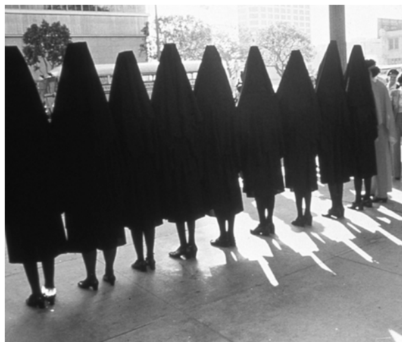
Fig. 4. Suzanne Lacy y Leslie Labowitz, In Mourning and in Rage , 1977

Faith Wilding –una de la artistas americanas más interesantes y en activo durante cuatro décadas– recrea visualmente la posición de la mujer en aquellos años en la performance Waiting (1971) (fig.3) y los anhelos que corresponden a una mujer desde su nacimiento. Sentada pasivamente con las manos sobre el regazo y mientras se balancea hacia delante y hacia atrás, declama un listado de ancestrales esperas que conlleva el hecho de ser/estar mujer: «...esperando para que alguien me recoja, esperando usar sostén, esperando la menstruación, esperando que él me llame, esperando casarme, esperando la noche de bodas, esperando que él llegue a casa para llenar mi tiempo...».