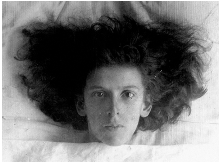
Fig. 2. Claude Cahun, Autorretrato , 1915

En sus autorretratos se desdobra una y otra vez travestida en múltiples personajes, cuyos roles constituyen un despliegue de identidades sorprendente e imaginativo, mostrándose en este sentido más «surreal» que los propios surrealistas, no muy alejados de los presupuestos burgueses sobre el lugar de las mujeres en el arte y en la sociedad. Y Claude Cahun (fig. 2) jamás asumió ese carácter subordinado, idealizado o mistificador que exigía la mirada masculina, rechazando la condición de musa, modelo adorable u objeto de deseo.