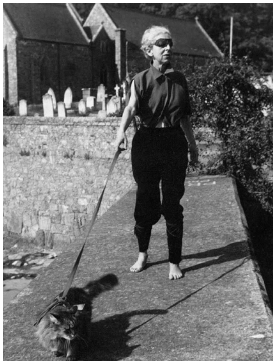
Fig. 4. Claude Cahun, Autorretrato , h. 1939

...sus mentes creativas al servicio de la esperanza en la rebelión de los soldados contra sus superiores. Según el relato de la propia Cahun, uno de los primeros gestos de desafío al orden impuesto por los invasores nazis, que ella y su amiga implementaron, fue el de cambiar las lápidas que marcaban la sepultura de cada nuevo soldado alemán muerto: «la nôtre était une