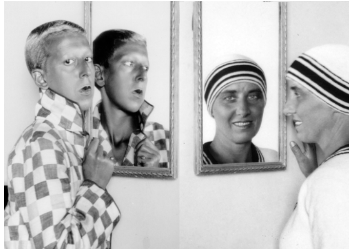
Fig. 6. Claude Cahun, Autorretrato con Suzanne Malherbe, 1928

Separar en Claude Cahun vida y obra resultaría imposible, además de contraproducente: perderíamos el hilo conductor de una biografía existencial entrelazada a propósito con su polifacética actividad artística, polémicas aparte sobre la pertinencia o no de aproximaciones teóricas contextualistas, en el ámbito de la reflexión estética.