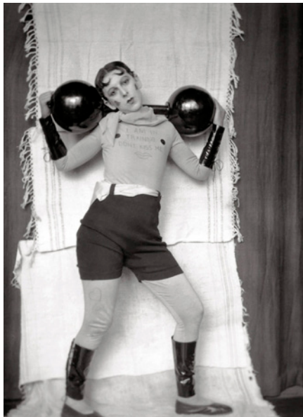
Fig. 10. Claude Cahun, Me estoy entrenando. No me beses , h. 1927.