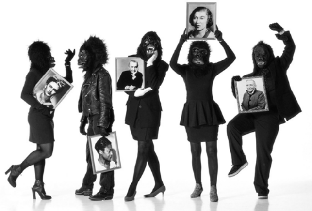
Fig. 8. Guerrilla Girls

Esta rebelión contra lo establecido, fue extendiéndose por las diferentes artes, adquiriendo mayor amplitud en las generaciones posteriores, dispuestas a mostrar abiertamente el poder de una sexualidad desinhibida y sin etiquetas: a Nan Goldin, Sarah Lucas, Zoe Leonard, Catherine Opie y un largo etcétera, se han ido sumando alteridades de diversa índole, que frecuentan las teorías queer , –adoptando como precursora en ocasiones a Cahun– en cuanto referencia