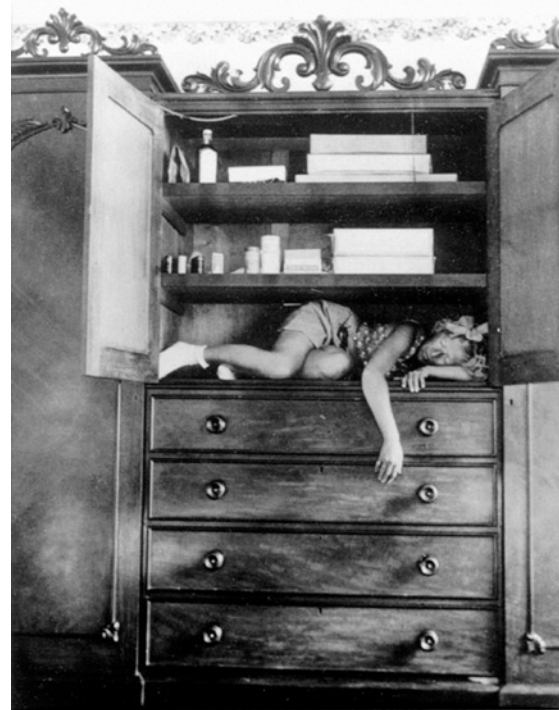
Fig. 4. Claude Cahun, Autorretrato , h. 1939

No en vano había puesto sus pies sobre un escenario, la actriz se adueña tanto de sus alter ego como de cuanto le rodea y procede en consecuencia: ropa, poses, maquillaje, máscaras –acumuladas, variadas o retiradas– sin llegar a la verdad última, niegan así la existencia de una «identidad verdadera» y, por tanto, de una falsa.