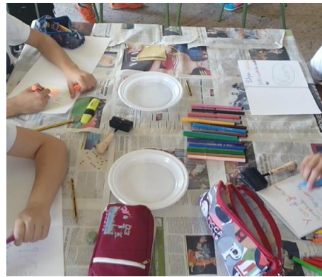
Figura 4. Palabra o frase para finalizar el Libro de Artista.