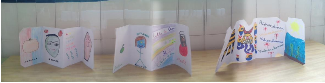
Figura 2. Hojas interiores del Libro de Artista.