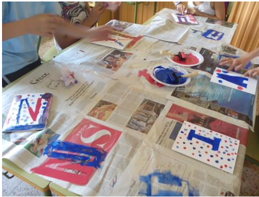
Figura 3. Plantilla de Acetato y diseño de portada.