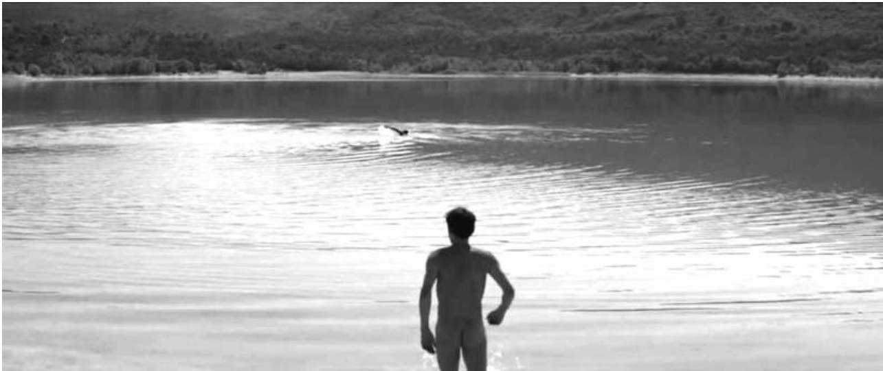
El desconocido del lago

Hay ocasiones en las que el azar actúa de extraña forma. Hemos visto como X-Men: días del futuro pasado se vincula con terquedad a una revisitación histórica del pasado y del presente, aunque la acción comience en 2023: pasados y presentes conflictivos donde los haya. Algo similar acontece con las recientes elecciones europeas o el asesinato de/por la militante del PP: el desprecio a la otredad, la intransigencia, el odio fruto del desconocimiento, hacen eco en las acciones más despreciables y la sociedad se envilece.