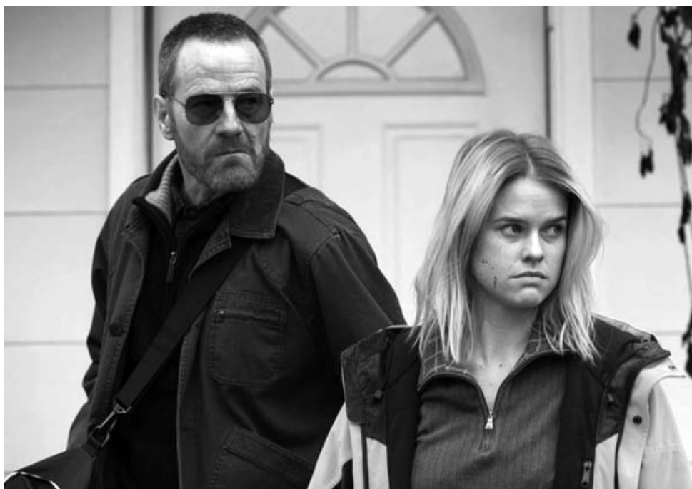
En el frío de la noche

binado con una reflexión acerca de personajes oscuros y en los límites, En el frío de la noche ( Cold Comes the Night , Tze Chun, 2013) ofrece un clima de tensión permanente cuyos resultados son francamente brillantes. Con su prodigiosa interpretación y un montaje con raccords directos constantes en los que se producen abundantes elipsis, Frances Ha (Noah Baumbach, 2012) resulta entrañable; algo así como la vida en directo (la frustración, el amor)... pero la vida de quién, porque el film, en blanco y negro, posee un poso clasista y grandilocuente. La poderosa Metro Manila (Sean Ellis, 2013) deja constancia tanto de la miseria humana como del heroísmo personal (a través del sacrificio) en un entorno denigrante; un grito contra la explotación. Tata lumea din familia noastra ( Everybody In Our Family , Radu Jude, 2012) representa otro buen ejemplo de cine rumano