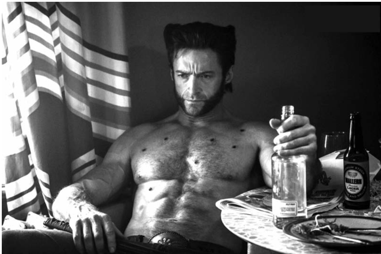
X-Men: Días Del Futuro Pasado

Se atribuye a Pío Cabanillas Gallas la humorada de “¡Cuerpo a tierra, que vienen los nuestros!”, que Rodolfo Martín Villa parafraseó cuando se vió venir el hundimiento de la UCD. Y no es por nada, pero tanto la sentencia consagrada por esos dos políticos conservadores, como la película que hoy nos ocupa, vienen al pelo para comentar el corrimiento de fuerzas que se ha producido en la izquierda a raíz de las últimas