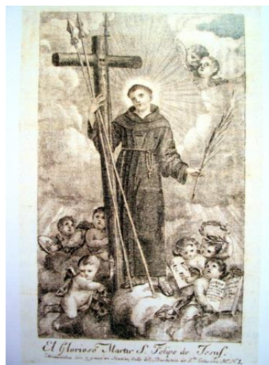
Imagen 9. Grabado San Felipe de Jesús, Madrid. (1751).

Analizando las imágenes nos damos cuenta, que los mártires normalmente siguen un orden de colocación. En el centro o primer plano aparecen los seis franciscanos y a los lados el resto de mártires. Además en la mayoría de imágenes los mártires aparecen con hábito religioso sin