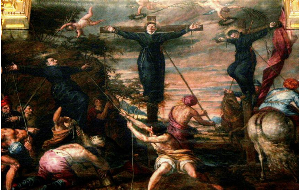
Imagen 6. SEBASTIÁN DE HERRERA BARNUEVO. Mártires del Japón, ático del retablo de las dos trinitades en la colegiata de San Isidro.

están siendo crucificados. En esta hermosa imagen observamos a dos crucificados y a uno que están levantando entre varios japoneses. El autor coloca a los japoneses con ropas y peinados orientales pero no japoneses. Como en el fresco de Perú, el autor coloca a querubines coronando con laurel y sosteniendo palmas encima de las cabezas de los mártires.