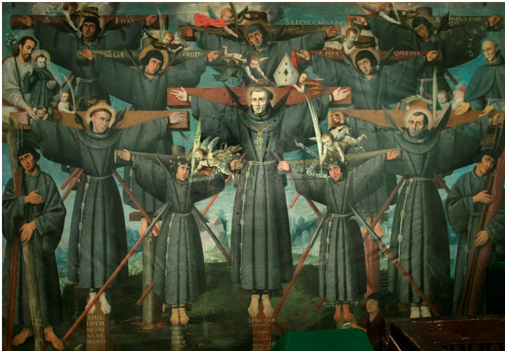
Imagen 3. Fresco mártires de Nagasaki: coro de la iglesia de Ricoleta. Cuzco, Perú.

la victoria de su martirio. A la derecha aparece el patrón de la orden y a la izquierda Jesús con el Niño Jesús vestido con el hábito.