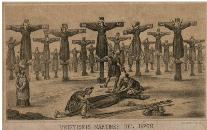
Imagen 4. FRAY AGUSTÍN DE OSINO. Grabado Historia de los 26 mártires de Japón .

la Compañía del Padre Ignacio de Loyola, pues le hubo en la compañía de Cristo. 4