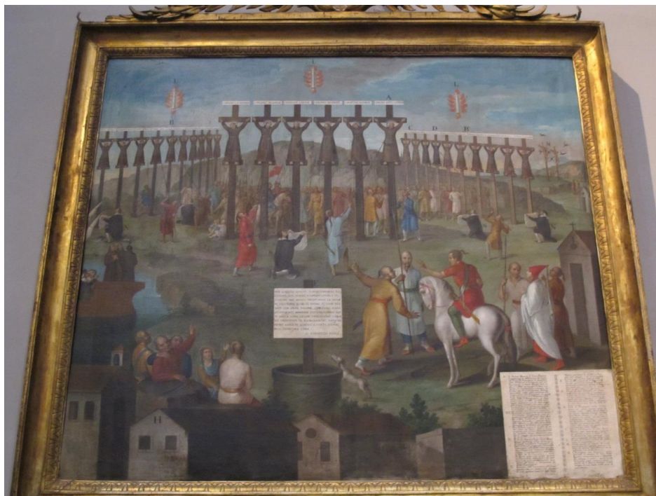
Imagen 1. Cuadro en la Iglesia de San Severo, Nápoles.

Frente a los mártires observamos a japoneses que son testigos de la crucifixión y a otros religiosos que son testigos desde un barco. La representación de los japoneses dista mucho de la realidad, esto se debe a que el autor, occidental, seguramente no había tenido contacto con ningún japonés. En el cuadro, también aparecen dos rótulos: uno en el centro que explica por qué y cuándo se realizó el martirio, y el segundo en la esquina derecha en el que aparecen los nombres de los mártires.