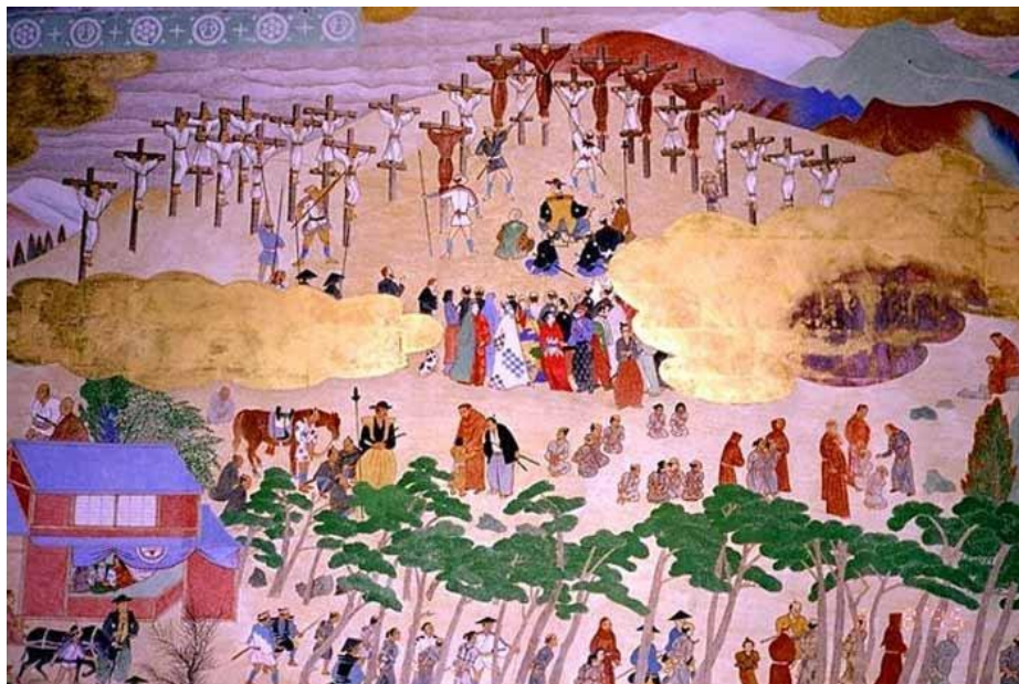
Imagen 2. Cuadro japonés de estilo Namban. Descripción del martirio.

En la parte de arriba aparecen los mártires crucificados y cómo clavan las lanzas al primero, Fray Felipe, bajo la mirada de Hasaburo a los pies de las cruces. En este cuadro, sin embargo, aparecen con hábitos solo los frailes y el resto vestidos de blanco. En la esquina inferior derecha, aparece una tienda con unos personajes ocultos por una cortina. Seguramente, esta haga referencia al emperador y a su condena.