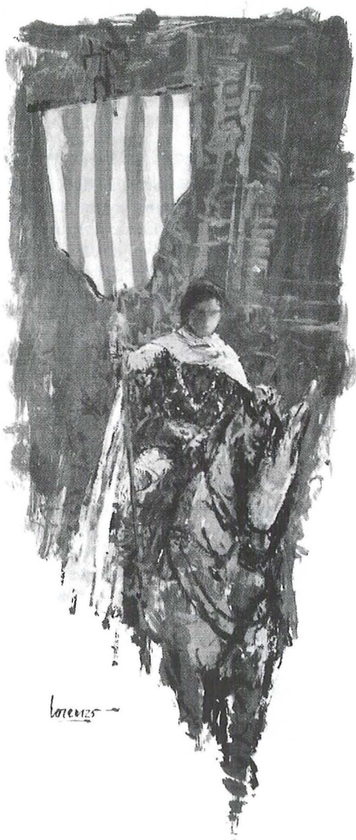
Jaume I Lorenzo Ramírez

que no es durà a terme. Tampoc no pot dir-se que la carta pobla de 1239 fos un fracàs absolut, ja que sens dubte alguns colons s'hi van instal·lar al castell, i progressivament també en algunes alqueries del pla. Però el paisatge humà i material continuava essent fonamentalment islàmic. El canvi es produirà arran de la sublevació mudèjar de 1247 i el consegüent decret d'expulsió dels musulmans ordenat per Jaume I el gener de 1248. Si bé aquesta expulsió no serà general, el monarca comprendrà que l'única manera de garantir el control del territori és assentar un nombre