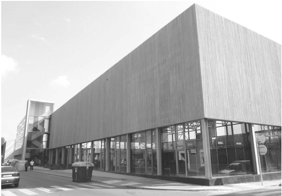
Nou pavelló poliesportiu de la Bosca, vist des del carrer homònim (Foto: I. Cabrera).