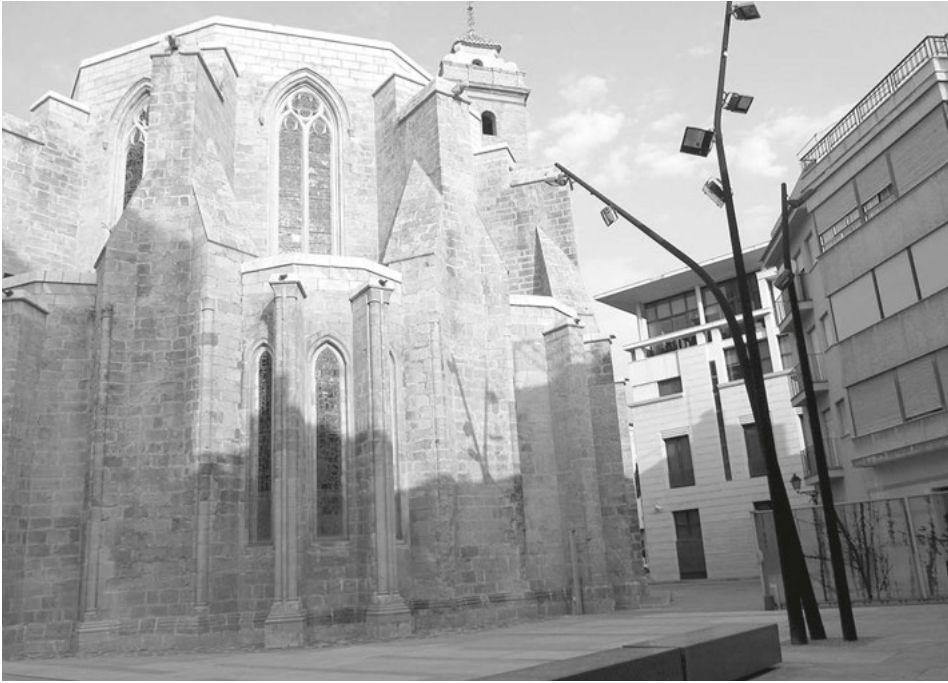
Vista exterior de l'absis de l'església del Salvador i de l'espai del fossar.

receptor inesgotable de qualsevol tipus de brutícia, i contínuament esmorteix el color. Aquest deslluïment del terra i altres detalls menors li han generat un ampli col·lectiu de detractors. Mentrestant, el també ampli col·lectiu de defensors es mostra satisfet per l'atorgament del Premi Nacional d'Arquitectura en Ceràmica que va rebre en 2007. Del mateix autor, i igualment dissortat, és el projecte de renovació del carrer de Sant Pere Pasqual i de l'extrem nord de la plaça de la Mercè. En aquest cas, els forts moviments que va experimentar el gran fanal que presidia la intervenció van qüestionar-ne la viabilitat, al mateix temps que els camions que accedien a una obra veïna trencaven sistemàticament les peces d'un paviment que no estava concebut per a trànsit tan pesant.