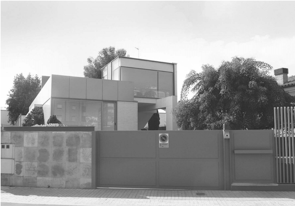
Habitatge unifamiliar situat al número 13 de l'avinguda de Jaume I (Foto: I. Cabrera).

Pel que fa als habitatges plurifamiliars, si acceptem les limitacions pressupostàries que els promotors solen imposar per a fer l'operació rendible, trobarem que durant aquest darrer quart de segle s'ha fet a Borriana una allau d'edificis que, en el millor dels casos, són intranscendents i, en el pitjor, autèntiques agressions al paisatge urbà carregades de pretensiositat. Tot i això, afortunadament també trobem exemples on els arquitectes han sabut combinar una adequada economia en una composició correcta i, en algunes ocasions, interessant. Mereixen menció els edificis situats al número 43 de l'avinguda de la Mediterrània, al número 2 del carrer de les Illes Columbretes, al número 8 de l'avinguda del Cardenal Tarancón i algunes promocions d'habitatges en filera de l'eixample del Grau.