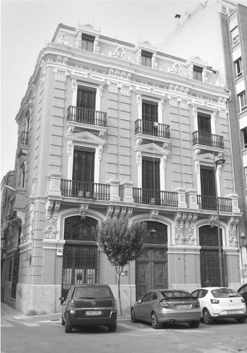
La casa Bernabé és la seu actual del Club 53.