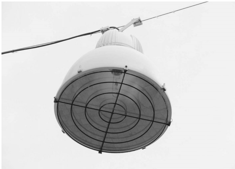
Nou fanal al carrer de Sant Vicent (Foto: I. Cabrera).

La reordenació del conjunt format per la plaça Major, els jardins i el Pla és l'exemple més obvi. Però resulta molt més urgent donar una solució a la terrassa Payà, un buit urbà ple de possibilitats que qualsevol ciutat desitjaria tindre al seu cor. El farcit d'aquest magnífic espai amb un volum edificat destinat a un ús tan profà com un aparcament o semblant suposaria un fracàs que encara s'és a temps d'evitar. De la mateixa manera, espera solució el conjunt format per la plaça del Mercat i la plaça d'Iturbi, la carretera del Port, la passejadíssima avinguda Mediterrània i, no cal dir-ho, els controvertits terrenys de l'Arenal.