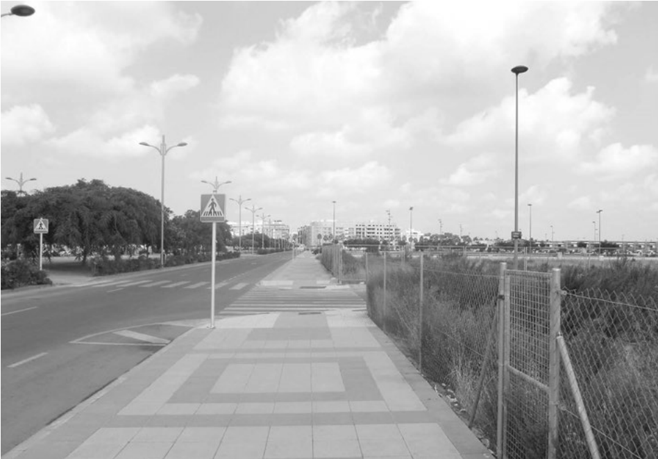
Avinguda de Londres al barri de Novenes (Foto: I. Cabrera).

cap tipus de planificació ni serveis s'han vist convenientment urbanitzats, no sempre amb el grat dels veïns, sovint molestos per haver de cedir els terrenys necessaris per a eixamplar els carrers i les zones dotacionals i pel pagament de les corresponents quotes d'urbanització. A més a més, les zones més atractives, com ara certs buits a primera línia de mar a la Serratella, han augmentat l'extensió dels barris de la Pedrera, el Port, la Malva-rosa i el Grau amb la disposició de nous carrers cap al poble. Tret de l'important creixement del Grau, la majoria d'aquestes ampliacions estaven previstes al PGOU de 1995. Tanmateix, les previsions d'Alejandro Escribano, pel que fa a sòl industrial i que es reduïen a la urbanització de les zones preexistents al voltant de la carretera de Nules i del camí Llombai, es van revelar insuficients. Així doncs, el parc empresarial de Carabona ha tingut una acollida excel·lent al municipi; però, el fet d'estar ocupat només al 50% posa de manifest que els múltiples parcs industrials que es van suggerir al voltant del camí vell de València i de la carretera de Vila-real eren absolutament innecessaris i només constituïen un negoci pròsper per aquells que gestionaren i materialitzaren el procés urbanitzador.