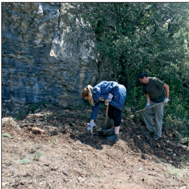
Figura 2. Procés de desbrossat de la superfície durant la primera campanya (any 2011).

El mes de juny de 2011 es va realitzar la primera campanya d'excavacions en la Fontanella. L'objectiu era la realització d'un sondeig de 2m 2 per a comprovar la seqüència existent i el seu estat de conservació. Després del desbrossat inicial i el quadriculat de la superfície vam decidir començar pels quadres B5 i B6, perpendiculars al fons de la balma i parcialment coberts per l'exigua visera conservada, deixant els quadres immediats al fons de la balma per més endavant (Figs. 2 i 3).