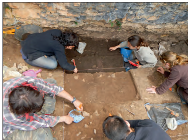
Figura 5. Procés d'excavació de la campanya de 2013.

entre les fases A i B, o inicis de la B. Aquesta adscripció pot realitzar-se per l'existència d'un cert equilibri entre els trapezidis i els triangles.