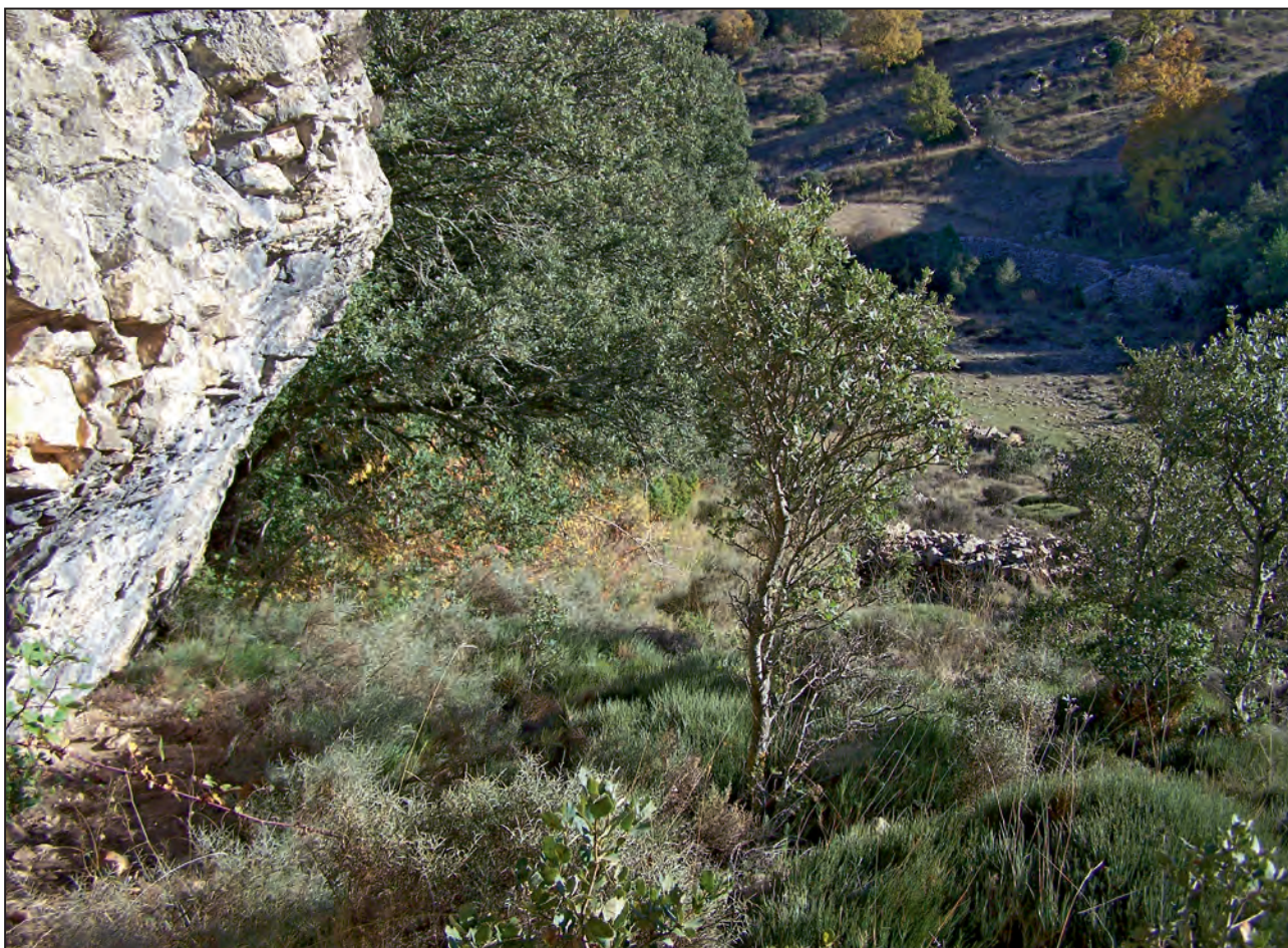
Figura 1. Imatge de la superfície de la balma l'any 2007.

i situada a 1120 m s.n.m. Es tracta d'una petita cavitat d'uns 6 metres de longitud, 2,2 m d'altura i uns 2 m de profunditat (Fig. 1).