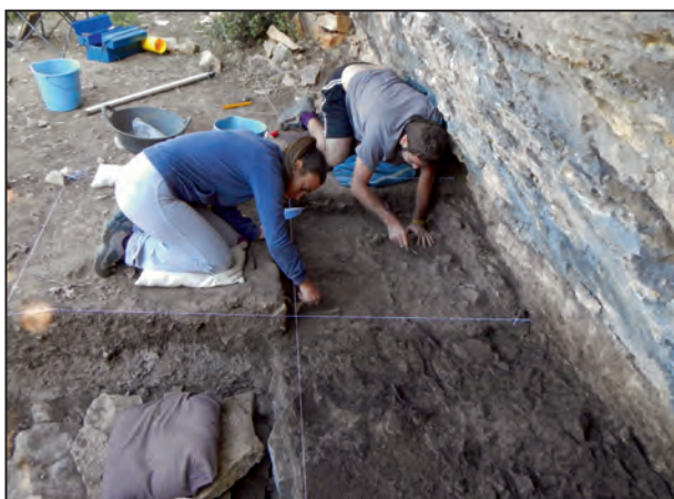
Figura 4. Procés d'excavació de la campanya de 2012.