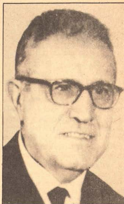
«La unitat del català és indèstribable.»

Aquest era un capellà molt liberal, i el bisbe de Tortosa d'aleshores no el tenia massa ben considerat. Per què?, doncs perquè era molt amic d'Aragonès, el cacic liberal de Sant Mateu, enfrontat amb l'altre cacic, el conservador Agramunt.