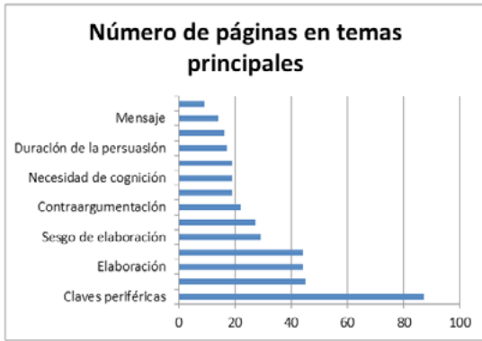
Gráfico 3. Número de páginas de los principales conceptos Volumen Petty y Cacioppo (1986)

Fuente: elaboración propia basada en Petty y Cacioppo (1986)