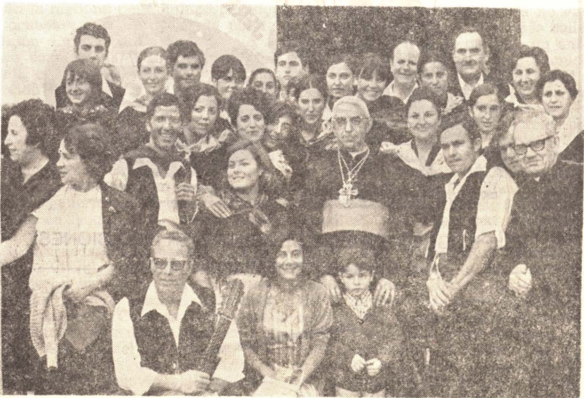
14.—Pasa por Vinaroz, almorzando en uno de nuestros establecimientos hoteleros, la famosa masa coral “Viva la gente”.