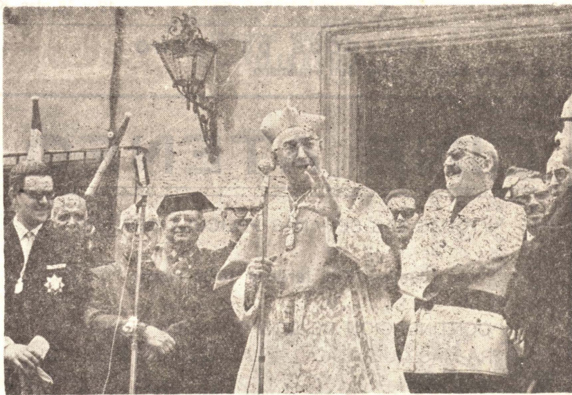
9.—El Cardenal Primado, visita Vinaroz, donde es objeto de cálidas pruebas de afecto y de filial devoción, siéndole impuesta la Medalla de Oro de la ciudad.

5.—Llega a Vinaroz los participantes del Rallye que diversos clubs vespa realizan por varias provincias españolas.